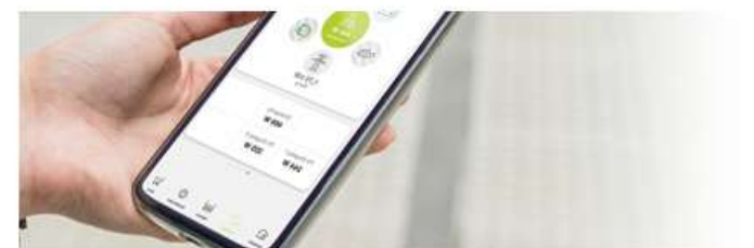
Option : appli smartphone