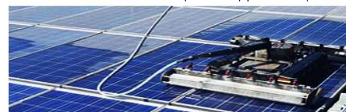
Option : entretien et maintenance