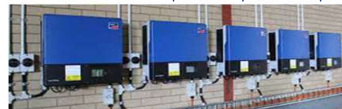
Cablage électrique et raccordement