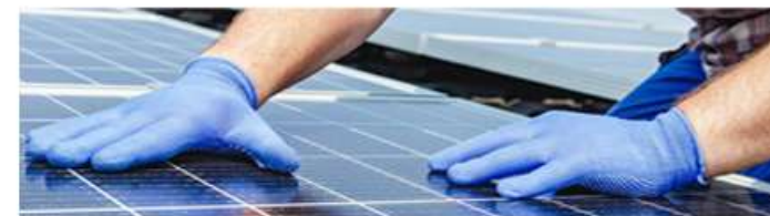
Pose des panneaux photovoltaïques