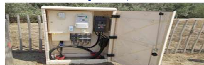
Raccordement au réseau EDF